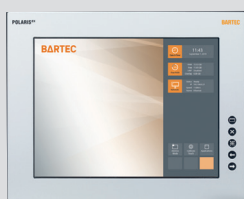
POLARIS Remote ZeroClient 15"