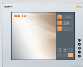
POLARIS Remote ZeroClient 19.1"