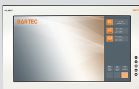
POLARIS Remote ZeroClient 17.3" W