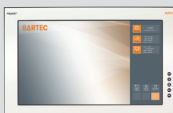
POLARIS Remote ZeroClient 12.1" W