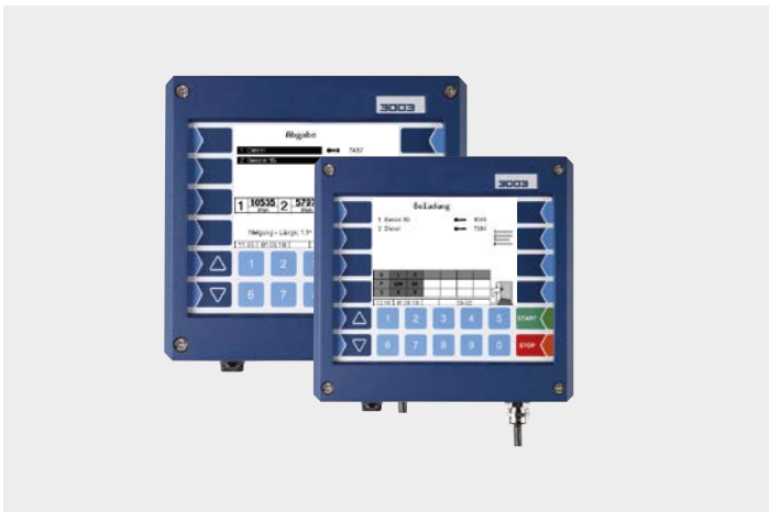
PETRO 3003 Safe/Spds

Modulare Systemlösung mit integrierter Datenkommunikation